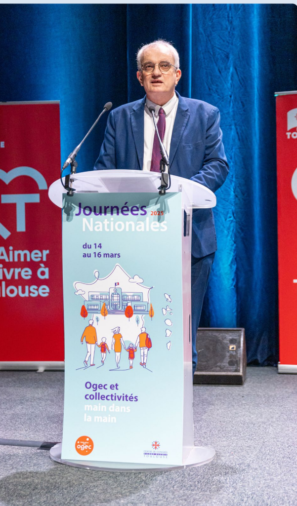
Philippe Delorme © Photo 7