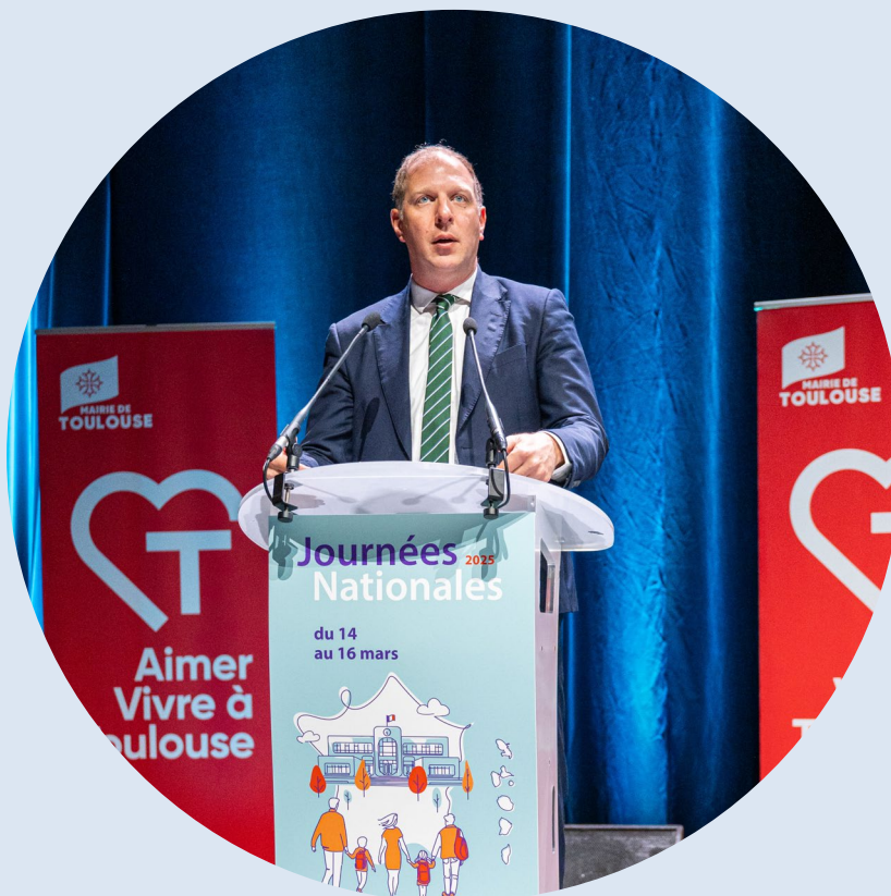
Pierre-Vincent Guéret © Photo 7

“ Ogec et collectivités, c'est un partenariat vivant, concret et essentiel.”