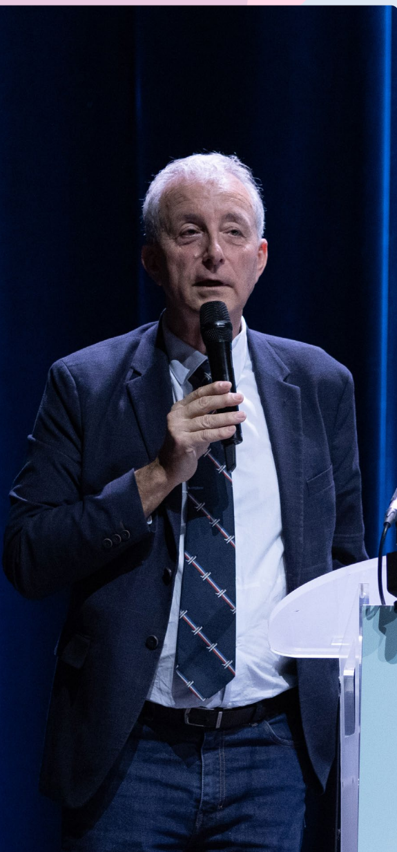
Philippe Perrin © Photo 7