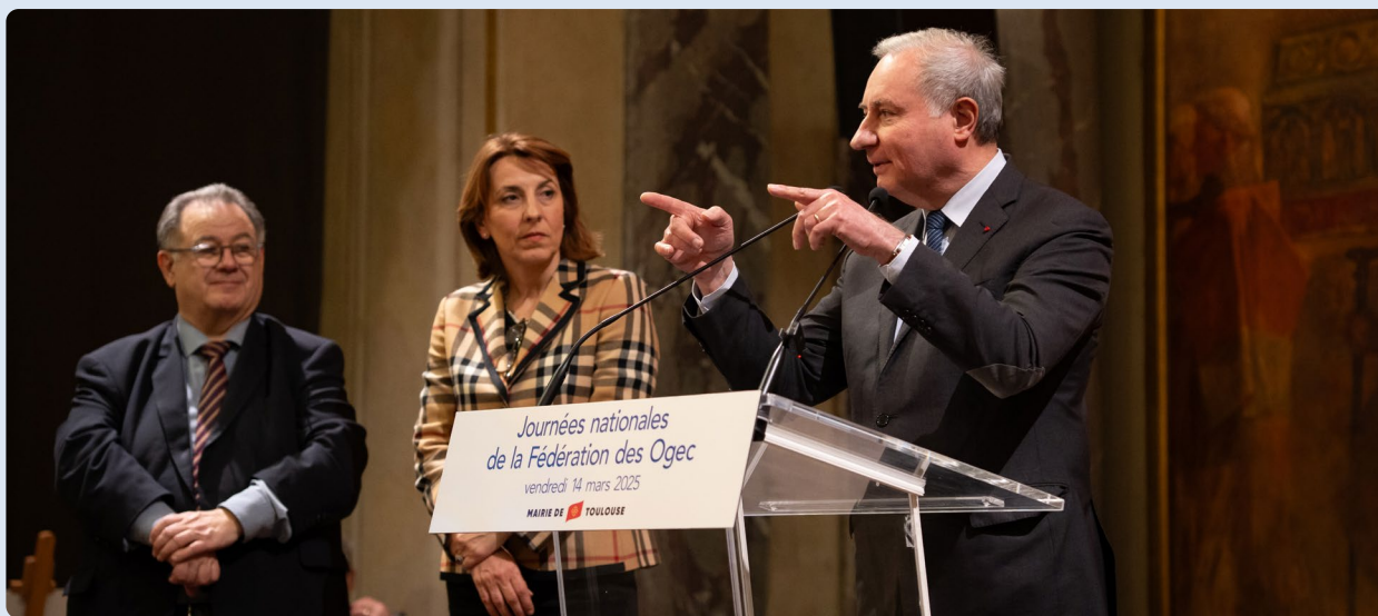
Au pupitre : Jean-Luc Moudenc, maire de Toulouse © Photo 7